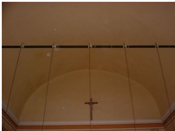
Figura 1: accelerometri fissati su una catena

Tra le possibili tecniche di indagine studiate in questi anni, le tecniche basate sull'analisi dinamica sono le più promettenti sia per la rapidità con la quale possono essere effettuate, sia soprattutto per la loro completa non invasività. Grazie allo sviluppo delle tecnologie informatiche ed elettroniche, tali tecniche possono oggi essere applicate a costi nettamente inferiori che in passato.