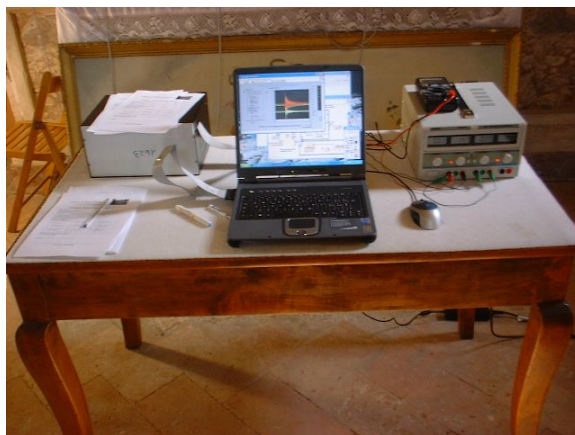
Figura 4: software di visualizzazione ed acquisizione