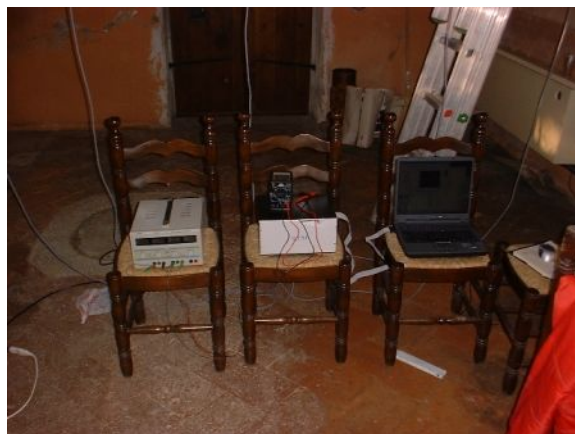
Figura 2: catena di misura (sistema di acquisizione, scatola di interconnessione, alimentatore)