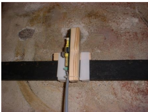
Figura 5: fissaggio di un accelerometro alla catena

Tramite tali elaborazioni è possibile poi risalire alle frequenze proprie della catena e da queste risalire ad una stima della tensione di tiro in essa presenti.