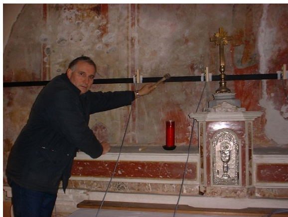
Figura 3: esecuzione di una prova